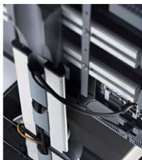
Detailansicht: Kabelführung Rückseite