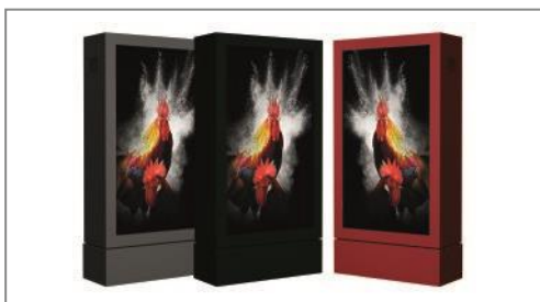
optional individuelle Farbgestaltung möglich