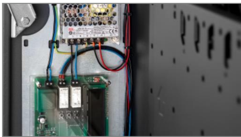
Verkabelung nach VDE-Richtlinien

Optional lässt sich die Stele in speziellen RAL-Farbtönen oder mit einem Logo individualisieren.