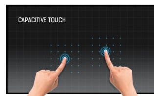
Touch Technologie - Kapazitiv

Dank des Android-Betriebssystems können Applikationen einfach installiert werden und der Bildschirm ganz flexibel Ihren Bedürfnissen angepasst werden.